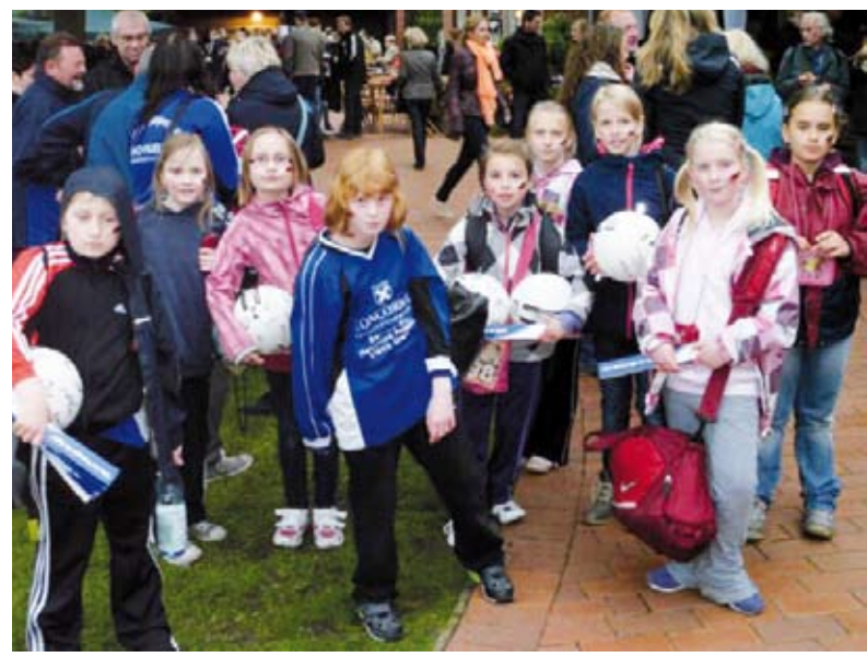
Nach einem langen und erfolgreichem Tag, konnten die Kinder viele Tipps mitnehmen.

Nach der Trainingseinheit gab es dann noch eine besondere Überraschung. Jedes Kind hat einen Ball bekommen und konnte sich diesen von den Nationalspielern unterschreiben lassen.