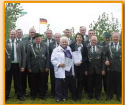
Ehrungen beim Schützenverein Steinbrink Seite 14