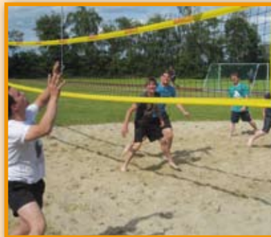
Sportfest des TSV Essern Seite 4