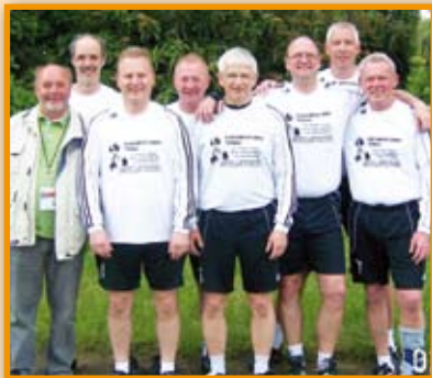
2. Platz beim Internationalen Deutschen Turnfest Seite 3

Schöne Ferien und einen erholsamen Urlaub!