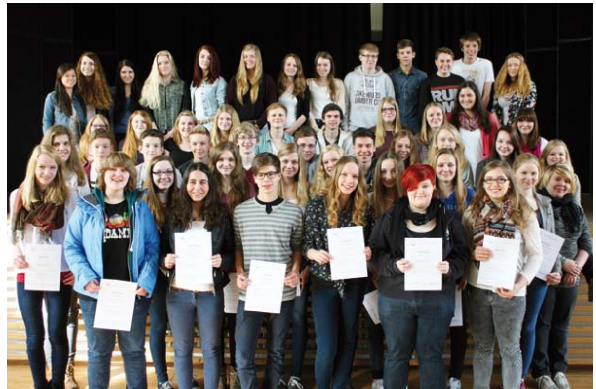
Die komplette Streitschlichter-AG des Gymnasiums Rahden.

Leider müssen auch in diesem Jahr viele die AG verlassen, da sie sich nun bald in der Prüfungsphase zum Abitur befinden. Jedoch werden die Abgänge durch die Neuzugänge mehr als ausgeglichen, so dass die gesamte Gruppe aus weiterhin rund 40 Schülerinnen und Schülern besteht.