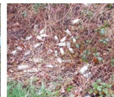
Maortstraße Ecke Heideweg - sollten hier einen Glascontainer beantragen?