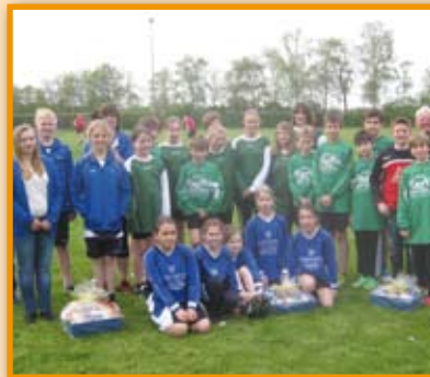
Faustballturnier in Essern Seite 8