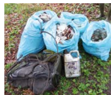
Das Ergebnis nach 500 Metern!

Im Frühjahr 2014 haben wir einen Spaziergang mit einer Müllsammelung am Wegesrand verbunden, unsere „Ausbeute“ nach den ersten 500 Metern: • drei Müllsäcke mit Glasflaschen („Flachmänner Weizenkorn“) • ein Müllbeutel mit sonstigen Glasflaschen, Dosen, Plastik etc. • 1 kaputte Reisetasche • 1 Kanister mit Altöl (unverschlossen!!!). Die diversen Haufen mit Gartenabfällen konnten wir leider nicht mitnehmen, da uns die Transportmöglichkeit fehlte. An dieser Stelle möchten wir keine Namen nennen (weder unsere noch die der Verursacher), aber wir möchten Euch bitten, Euren Müll künftig an den offiziellen Sammelstellen zu entsorgen! „Die Heide“