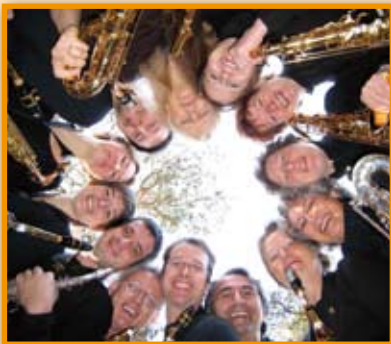
Mitreißende Musik auf Saxofonen Seite 3