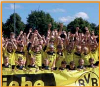
Fussballschule gastiert erneut in Lavelshoh Seite 3