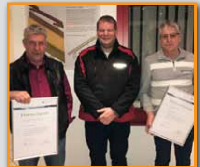
25 Jahre bei Körper Bedachungen Seite 15