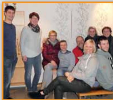
MTV Nordel spielt „Perle mit Köpfchen“ Seite 11